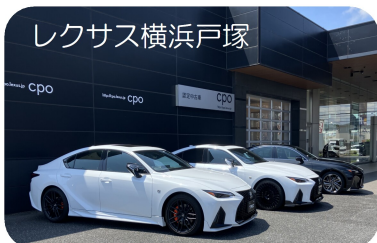
レクサス横浜戸塚