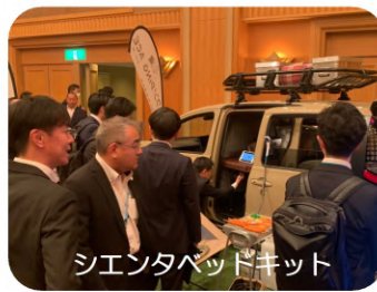
シエンタベッドキット