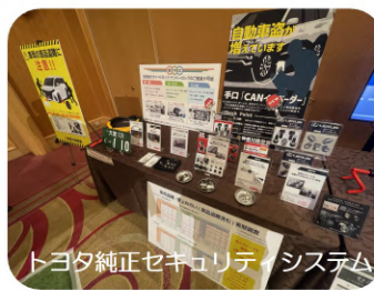
トヨタ純正セキュリティシステム